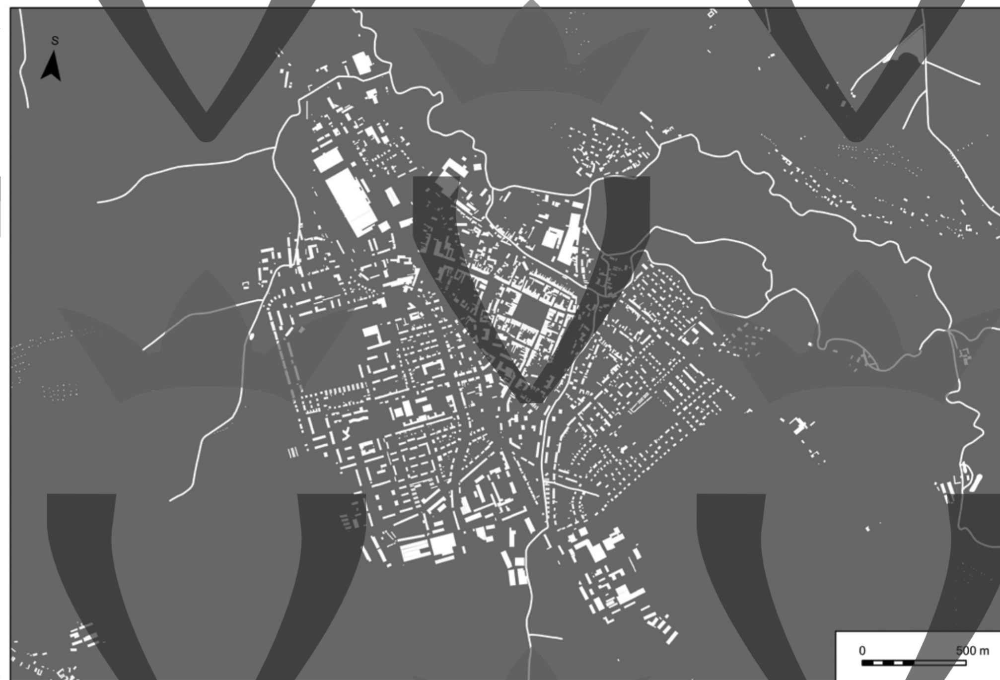
Mapa č. 28b: Negativní plán Vysokého Mýta a okolí s vyznačením půdorysu města a uličních bloků počátkem 21. století