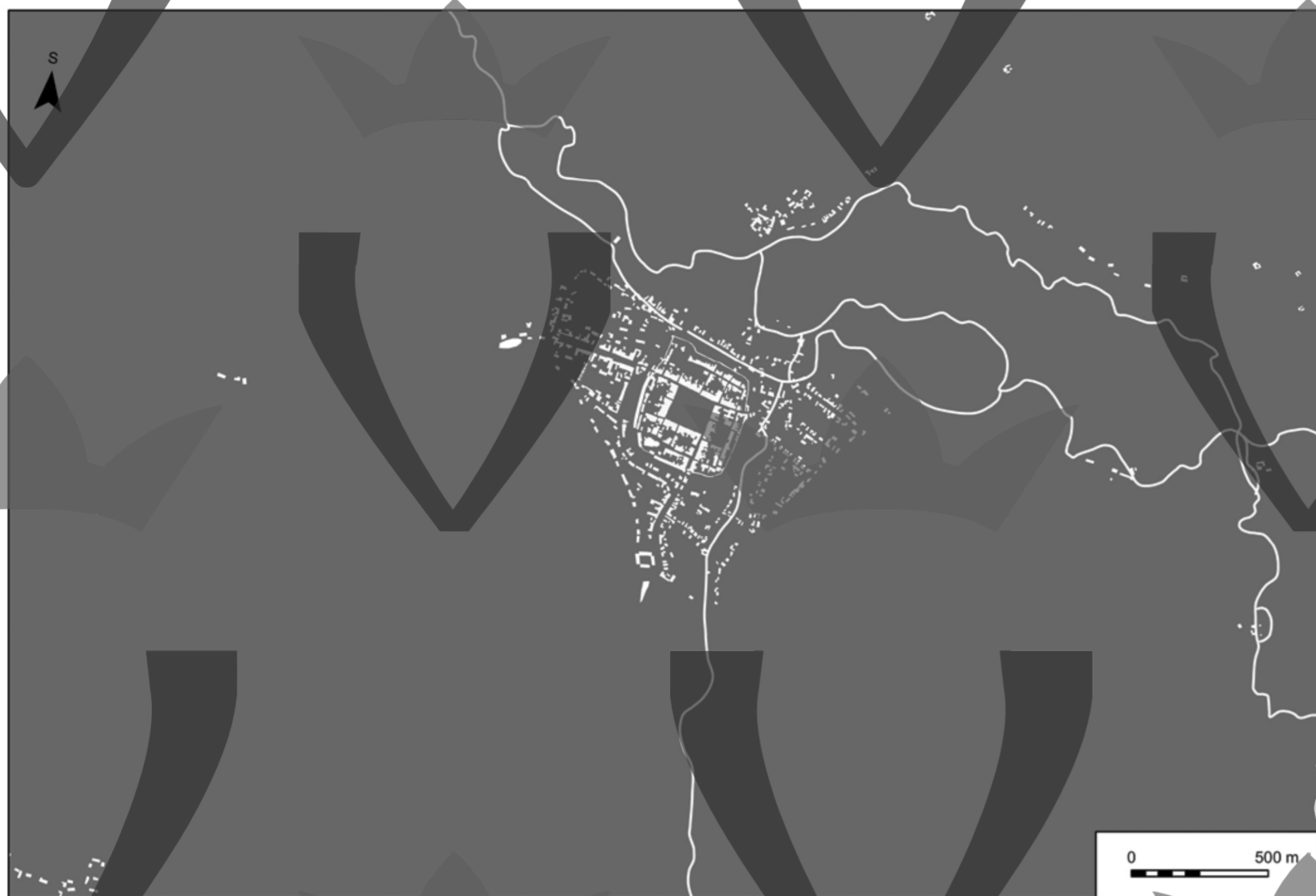
Mapa č. 28a: Negativní plán Vysokého Mýta a okolí s vyznačením půdorysu města a uličních bloků podle mapy II. vojenského mapování Čech z let 1852–1853